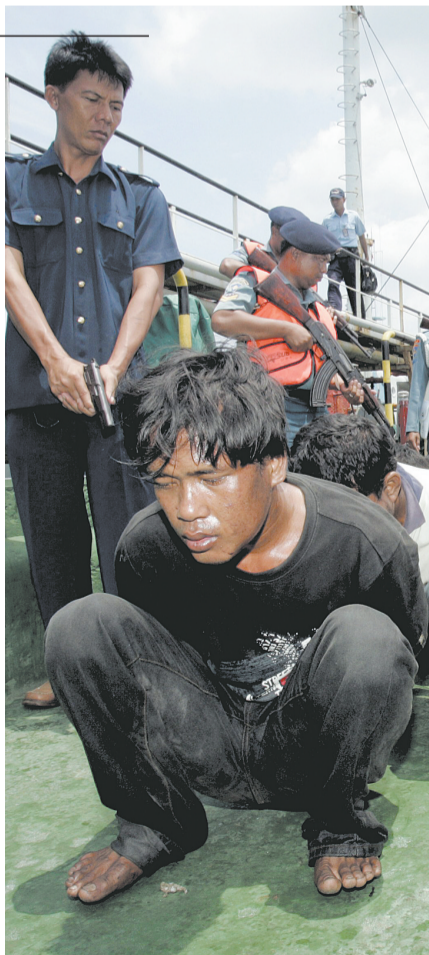
去年9月，在航行于新加坡海峡的一艘轮船上，印度尼西亚海军人员看押一批被抓获的海盜。

在打击索马里海盜问题上实行全球合作，共同打击，是唯一的出路，而这种构想中的“多国海上警察”能否有效遏止索马里海盜的嚣张气焰，恐怕将取决于各国的决心、投入，索马里局势的发展，甚至国际热点争端的态度演变。 微言