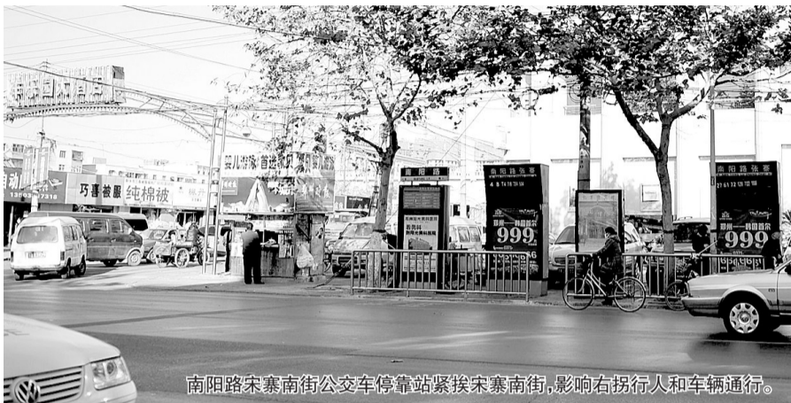
南阳路宋寨南街公交车停靠站紧挨宋寨南街,影响右拐行人和车辆通行。