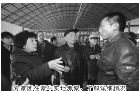
专家团在蒙牛实地考察,了解详细情况

很多专家在会上纷纷表示,窥一斑而知全豹,从蒙牛的牧场和工厂就可以看出,中国乳企已经具备了世界先进的生产能力,“生产出世界品质的产品”是个完全可以实现的目标。蒙牛在奶站挤奶厅安装了摄像头,给恒温运奶车上GPS定位系统,让每一滴原奶都处