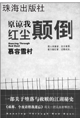
珠海出版社 原凉我红尘颠倒 慕容雪村