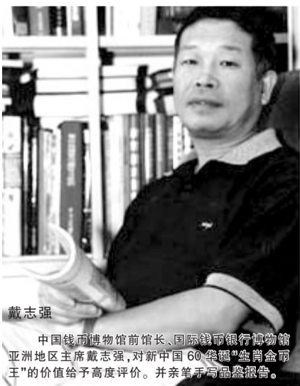
戴志强 中国钱币博物馆馆长、国际钱币银行博物馆亚洲地区主席戴志强,对新中国60华诞“生肖金币王”的价值给予高度评价。并亲笔手书品鉴报告。

每套配备唯一对应编号的公证书、收藏证书、国家金银检测证书、专家题词卡和前中国钱币博物馆馆长戴志强和中国民族博物馆馆长谢启昆的品鉴报告等,中国收藏家协会破例为各城市发行点特设咨询热线。郑州市指定发行点是南阳路郑州市图书馆一楼,发行热线0371-66688628。特别提示:因金银版配额紧缺,目前只随纯金版成套购买,敬请谅解。