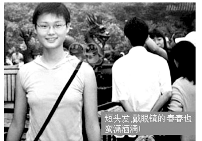
短头发、戴眼镜的春春也蛮潇洒滴！

我大概看了一下他们的作文，虽然是小时候写的东西，但是很能反映一个人的性格特点。李宇春这个姑娘，别看她舞台上像男生一样蹦蹦跳跳的，从她小时候作文就可以看出，她应该还是很有思想的，比一般的女孩有想法。我觉得一个人的水平高低不重要，重要的是要有自己的独特想法。我就准备把李宇春的作文拿给我儿子看看，让他好好学习一下人家的作文水平。还有何炅的文章，一看就觉得这孩子上学的时候一定是个好学生，小小年纪就钻研了很多文学名著。我觉得李宇春和何炅的文章都是值得现在的学生去学习的，我就会告诉我儿子，明星可以喜欢，但是要能从中获取对自己有价值的东西，用这些明星作文给儿子上课，可能会比很多教科书的效果还好呢。