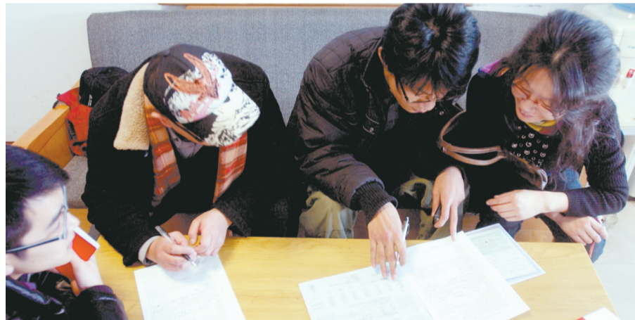
考生在金水区报名点填写报名表。