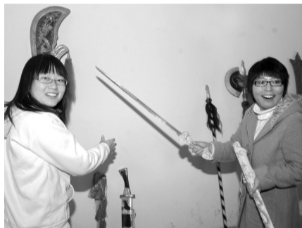
同学们对戏剧用的兵器很感兴趣。