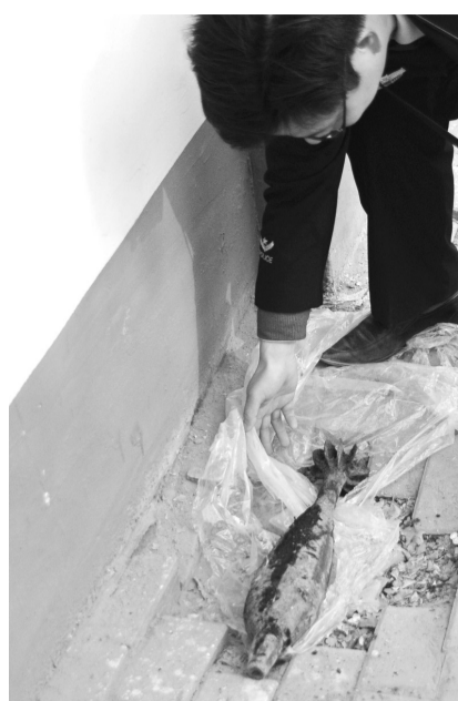
警方在现场勘察。