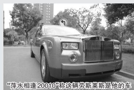
“萍水相逢20010”称这辆劳斯莱斯是他的车

日前,有位富翁父亲在网上公开招倒插门女婿,并开出价值过千万元的条件。该帖发出后,众网友在感叹“可怜天下父母心”的同时,也不禁质疑,爱情真的能用钱来衡量吗?