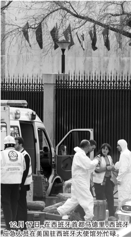
12月17日,在西班牙首都马德里,西班牙应急人员在美国驻西班牙大使馆外忙碌。

美国官员17日说,连日来美国驻欧洲15个国家使馆收到内含可疑白色粉末的信件,部分使馆因此暂时关闭。此前一天,美国联邦调查局方面说,美国国内超过40个州的州长办公室收到类似信件,但检测发现这些粉末都并非有毒物质。