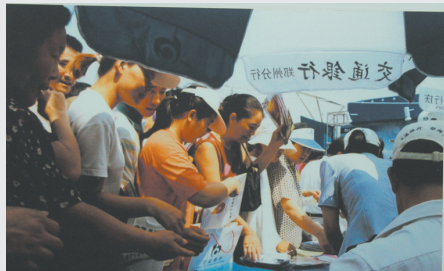
交通银行新产品推介宣传活动