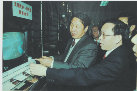
1996年4月,时任中国人民银行行长戴相龙(左一)在交通银行视察