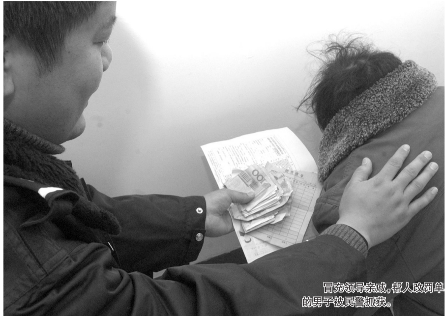
冒充领导亲戚,帮人改罚单的男子被民警抓获。

“200的条我要300,300的条我要400块钱……”他说,一般找他的都是熟人,大都不知道要罚多少钱,于是自己以找关系为由,为他们交纳罚款,“如果民警给面子我就多赚点,但基本上都是全交,我大都是每个单子多收朋友100元钱的利润。”