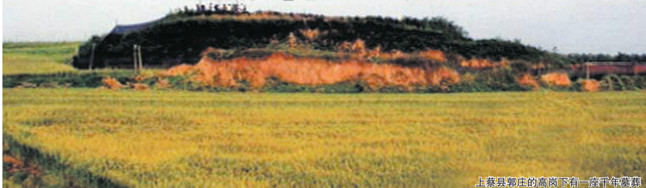
上蔡县郭庄的高岗下有一座千年墓葬