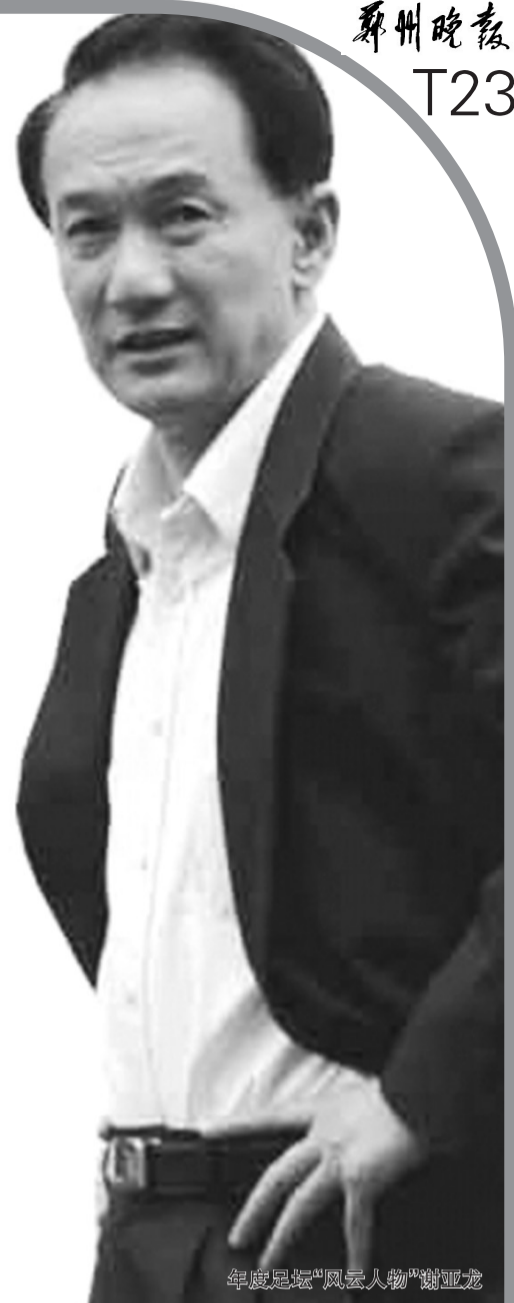
年度足坛“风云人物”谢亚龙

如今的黄健翔在很大程度上俨然是个娱乐人物,为这个全面娱乐化的时代提供了难得的搞笑、整蛊素材。