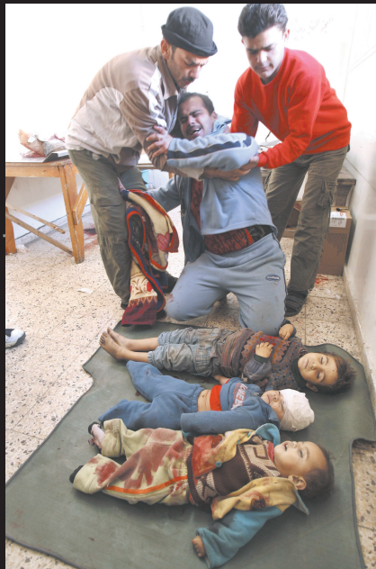
1月5日，在加沙地带的一家医院，一名男子面对三名在以军袭击中丧生的儿童的尸体痛不欲生。