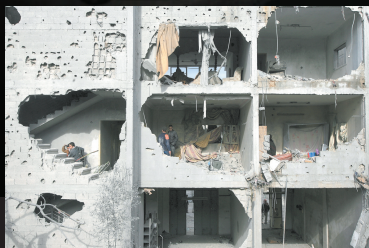
1月2日，加沙地带北部杰巴利耶难民营里的一座楼房被炸得千疮百孔。