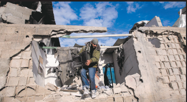
1月3日，在加沙地带南部城镇拉法的一个难民营，一名巴勒斯坦人从废墟中捡回一台电视机。