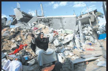
1月3日，在加沙地带南部城镇拉法，一名妇女坐在被以色列军队空袭摧毁的房子前。