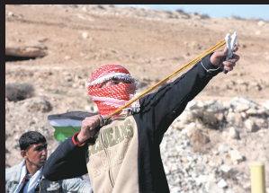
1月5日，在约旦河西岸城市希伯伦附近，一名巴勒斯坦少年向以色列士兵投掷石块。