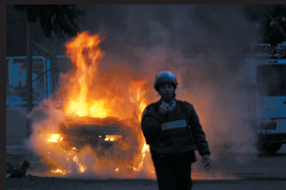
1月2日，在以色列南部城市阿什凯隆，一名以色列警察站在一辆被火箭弹击中的汽车前。