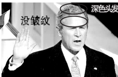
2001年1月20日,布什在就职典礼上。