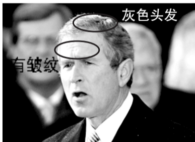
2005年1月20日,布什再次宣誓就职。