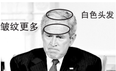
2009年1月5日,布什在白宫就巴以局势发表讲话。