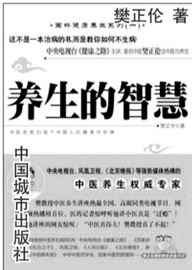
禁正伦著 养生的智慧

中医说的喜、怒、忧、思、悲、恐、惊等情志的变化和人的五脏是休戚相关的。其实我们在看历史小说的时候,这样的人比比皆是。大家看过《三国演义》,你看那周瑜,周瑜那么年轻,就是因为他嫉贤妒能,由于他的心态不平衡了,老觉得诸葛亮比他聪明,老不服气。说诸葛亮把他气死了,不如说他自己把自己气死了。 06