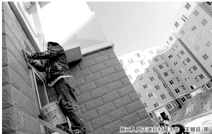
施工人员正在进行扫尾工作