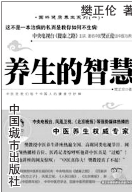
禁正伦著 养生的智慧 中国城市出版社

“尽人事,智于圆,而行于方。”考虑问题尽量全面,处理问题尽量果断。做完了,谋事在人,成事在天。如果你这件事,吃饭也想着它,睡觉也想着它,觉得舍不了,放不下的时候,这时候其实你就已经动心了。所以我建议大家,一定要注意做到勤动脑体不动心。