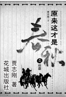
贾志刚著 原来这才是春秋 华城出版社

“你们都下去。”申后知道琼瑶的意思,下令身边的侍女都走开,只剩下琼瑶一个人。琼瑶给申后讲了一个故事,一个令申后兴奋的故事。