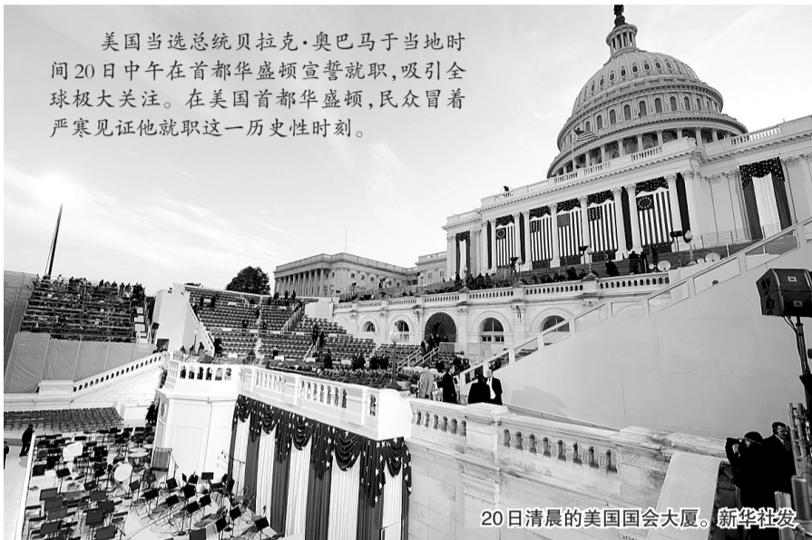
20日清晨的美国国会大厦。

他当晚计划参加数场晚宴。这些晚宴主题是表彰“跨越党派界限”为公众服务的3名美国人,其中两人为共和党人:前国务卿鲍威尔和奥巴马曾经的竞选对手麦凯恩。