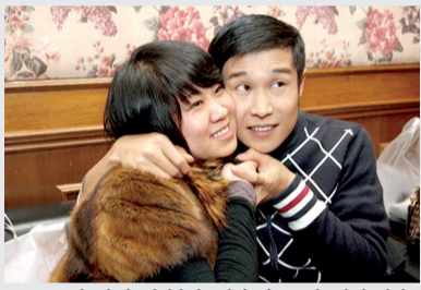
春晚表演结束后和妻子在后台庆祝