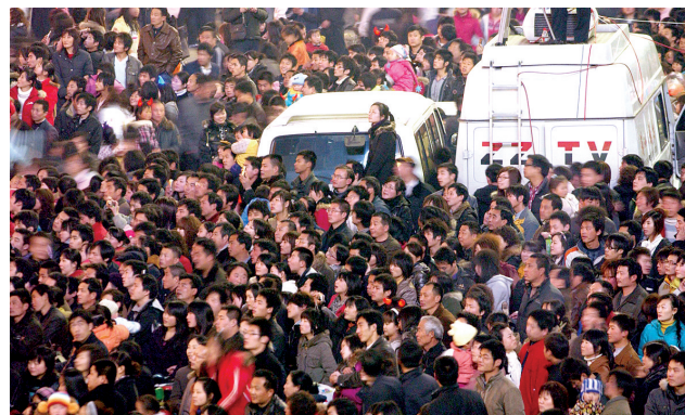
人流如织的二七广场。