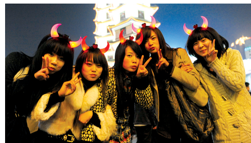
二七广场上,戴牛角的女孩。