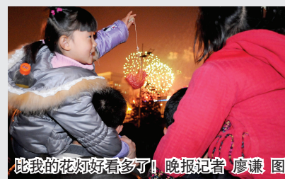
比我的花炮好看多了!

昨晚,当空皓月,整个绿城流光溢彩。郑东新区、郑州市体育场和五一公园3个燃放点烟花满天,让广大市民度过了一个难忘的元宵佳节。与往年不同的是,由于昨晚天空晴朗,观赏效果极佳,今年看烟花的市民明显增多。据郑州市有关部门统计,昨晚3个燃放点共计燃放礼花弹近1万枚。 晚报记者 孙娟 张璇 张玉东 通讯员 李宁