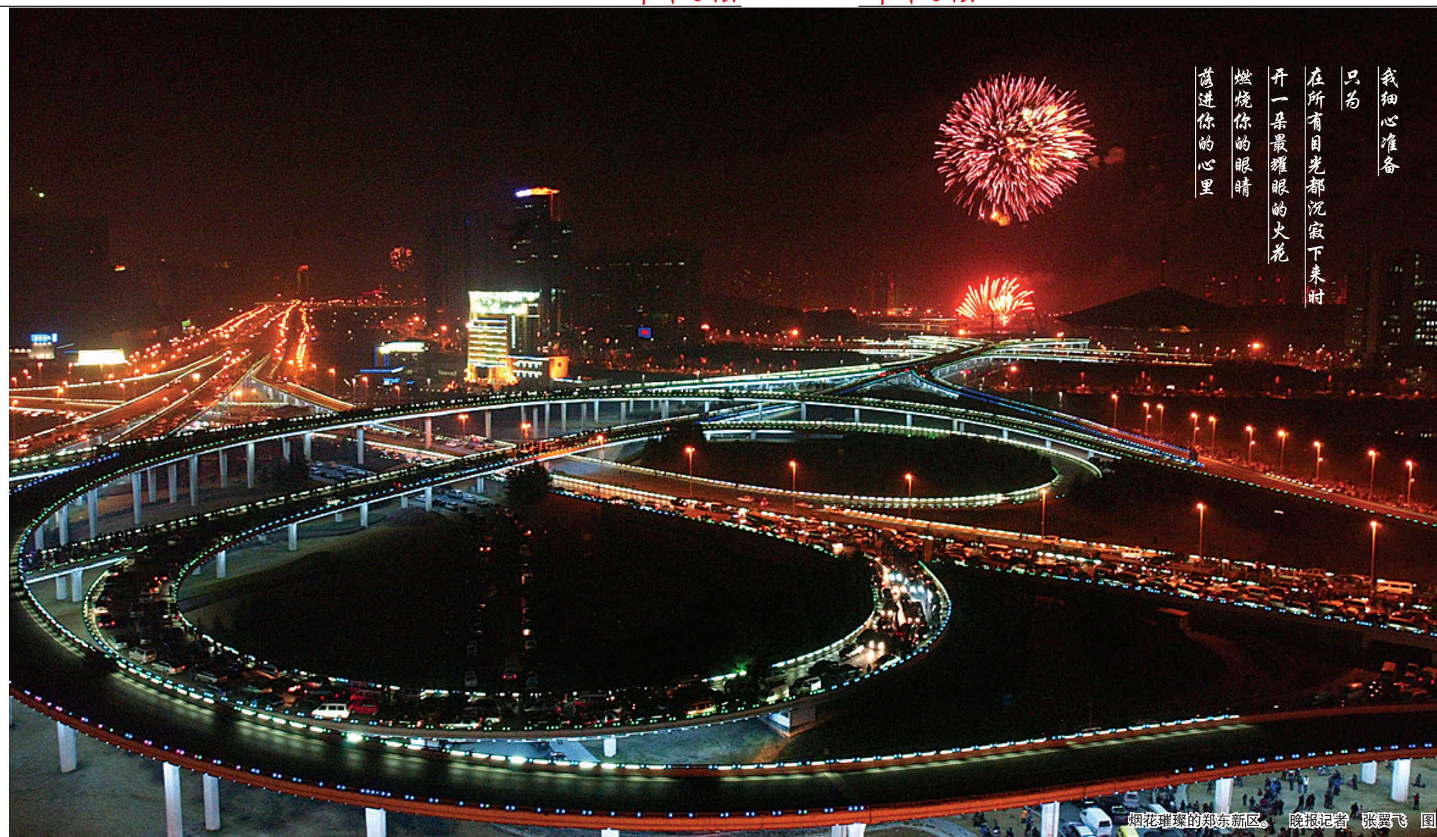
烟花璀璨的郑东新区。

我 只 为 在 所 有 目 光 都 沉 寂 下 来 时 开 一 朵 最 耀 眼 的 火 花 燃 烧 你 的 眼 睛 落 进 你 的 心 里