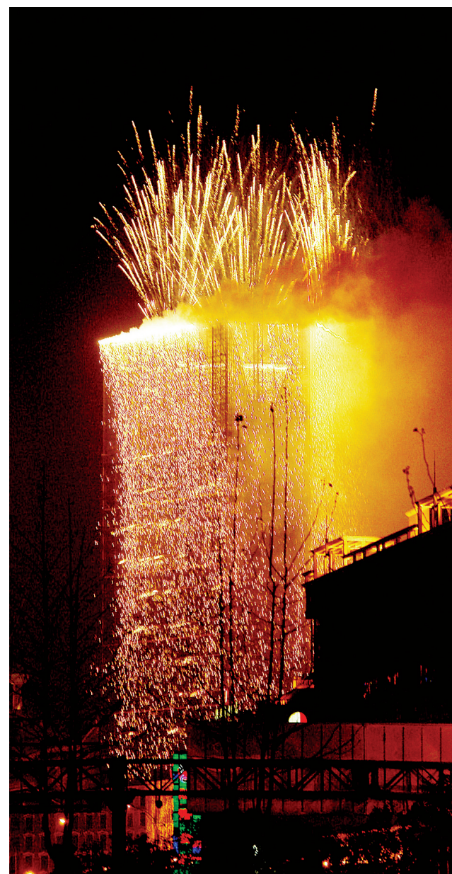
内地首例墙体冷焰火秀在金水路和民航路交叉口一幢大楼举办。120米高的冷焰火瀑布,整座大楼像披上了一件落地的金色纱裙。