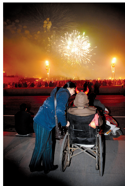
推着老人到郑东新区看烟花。