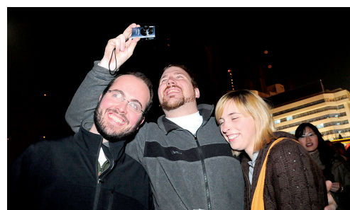
来自美国的朋友感受着中国的元宵节。

餐厅、酒店推出“观焰火位”“观焰火房” 昨晚8时,随着郑州市上空第一朵烟花的绽放,一些观赏焰火位置绝佳的饭店内也是人潮涌动。据悉,CBD内环餐厅“观焰火位”半个月前就爆满,不少近郊燃放点的星级酒店也推出了“观焰火房”。