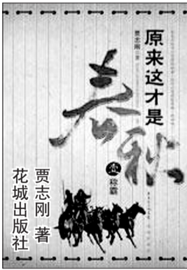
贾志刚著 原来这才是春秋 花城出版社

“大王,社稷为重啊,这个时候了,还要儿女情长?”姬友有些愤怒了,他恨不得给幽王一记耳光。“不,没有了褒后,要社稷还有什么用?备车,我要带着他们一起走。”幽王说得坚决,让姬友竟然也有些感动起来。