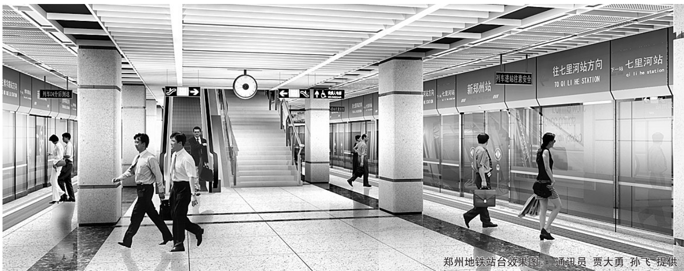
郑州地铁站台效果图。