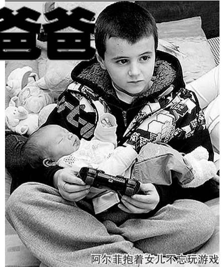
阿尔菲抱着女儿不忘玩游戏

已为人母的小女友也不过15岁,去年偷尝禁果怀孕 全国舆论哗然,首相布朗强烈批评未成年早孕现象