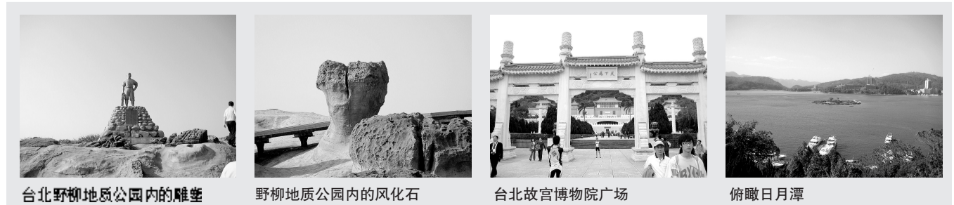
台北野柳地质公园内的雕塑

款应注明公司名称、地址、电话(加上区号)并加盖单位公章,任职不足半年需要原来单位同时出具在职证明信]。学生提供“学生证复印件”或是“在校证明”和请假证明原件,其中18岁以下少年儿童赴台需4种身份监护(父亲、母亲、祖父、祖母)带领前往;如18岁以下少年儿童和带领人不在同一户籍上,需到户口所在地公安局办理关系证明。退休(退休证复印件)和无业人员提供存期3个月以上本人名义5万人民币以上银行存款证明原件,或同等金额银行存单复印件。此外,还要填写“大陆地区人民来台观光申请书”并需要本人签字。在各种手续齐备的情况下,台湾方面的办理时间为5个工作日。