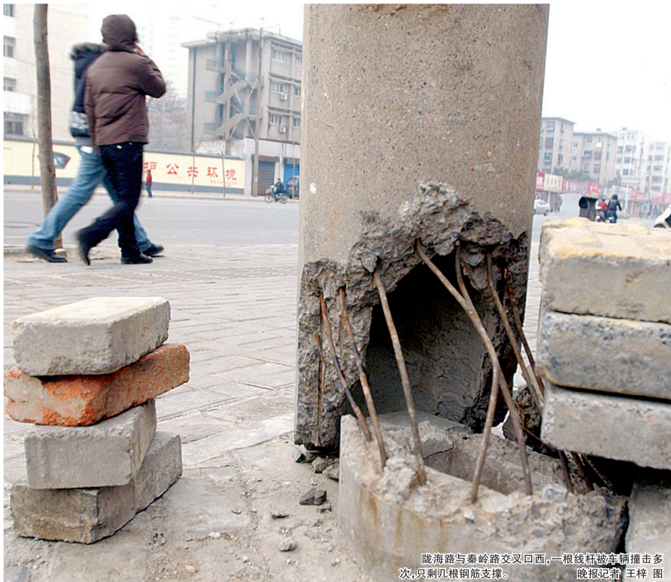
陇海路与秦岭路交叉口西,一根线杆被车辆撞击多次,只剩几根钢筋支撑。