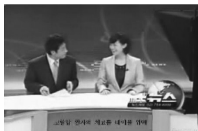
韩国MBC电视台《5点新闻》报道食疗

下。 ●冠心病、脑梗病人，血管堵塞50%以上，食疗一个月，血管畅通恢复到80%。