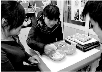
市民前往豆腐店品尝取经。