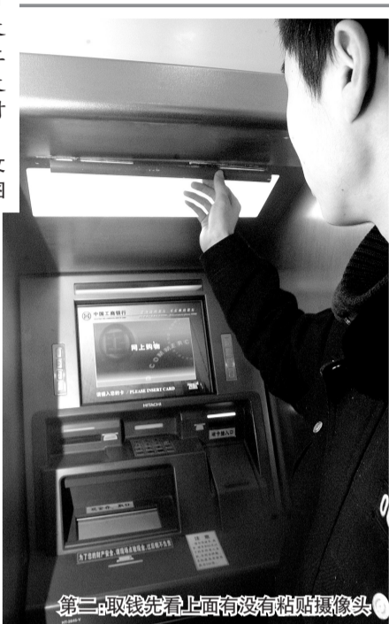
第二:取钱先看上面有没有粘贴摄像头