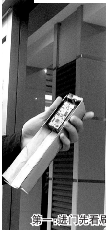
第一:进门先看刷卡器有没有“长个”