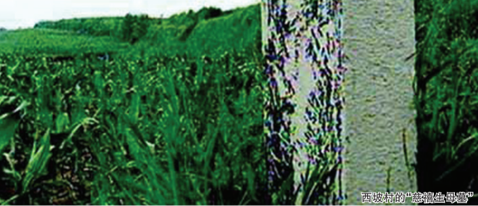
西坡村的“慈禧生母墓”