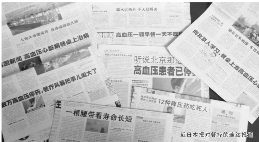
近日本报对餐疗的连续报道