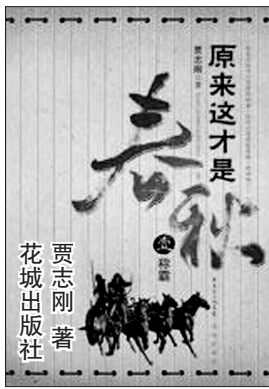
贾志刚著 花城出版社

石厚这样的人才,还真是不好找。如今世界,也常常用挑起外战的办法转移执政危机。说起来,祖师爷就是石厚。