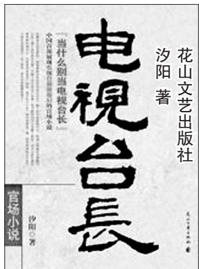
花山文艺出版社 汐阳著

上来自然是了解情况。平川电视台是1989年成立的,目前办有一套综合频道和一套图文频道。通过交谈,张镇得知了电视台的目前状况:二老二多。二老:一是设备老化,采编播设备就像快散架的老破车,型号落后,故障频发;二是节目老化,设置的那些新闻专题文艺节目,名字老、内容老、形式老,对观众的吸引力差。二多:一是广告收入少,一年毛收入才1200万元,交完税费、刨去提成,账上也才800多万,而全台180人,连工资带奖金一年就得600万,大楼运转费,一年也得350万,就是说不敷出;二是一线业务骨干少,凭关系进来的人不少,可业务上大多是白丁。想进点人才,却受编制控制。自己招聘临时工吧,又因工资待遇太低,也招不来几个有用的人才。二多:一是欠债多,主要是五年前盖大楼欠了4000万;二是欠职工的利益多,主要是多年没提拔科长、多年没增加职称名额。