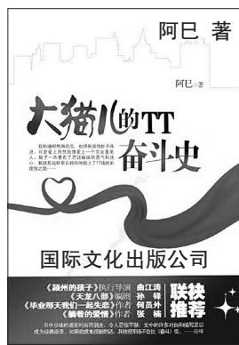
阿巳著 国际文化出版公司

“对呀!”我恍然大悟,“你怎么不早告诉我?你想裴格为什么都快三十了还没个正式的女朋友?说不定就是因为她妈特厉害,谁都没法跟她相处,所以干脆找个学历低点儿、条件差点儿的,过了门只有乖听话的份儿。可是我看着也不像那种逆来顺受的类型吧?”小乔白了我一眼:“你就瞎琢磨吧!我只是提醒你这种家庭有可能婆媳关系不好处,你这都想哪儿去了?说得跟真事儿似的!”