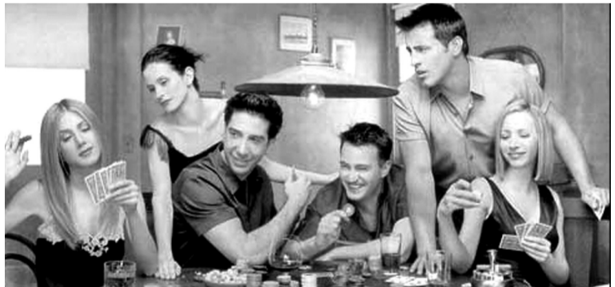
美国电视剧《老友记》讲述了一帮朋友住在一起的故事