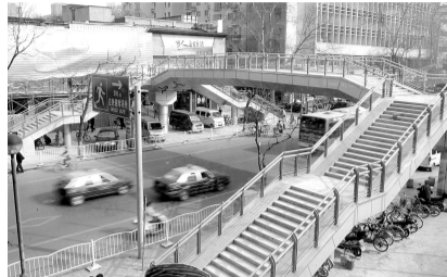
二七路人行过街天桥

贷款申请人婚姻状况为离异的,要提供离婚证。由法院调解或判决离婚的,提供“民事调解书”或“民事判决书”。同时,提供原配偶的身份证号码及相关证明(原结婚证或原婚姻登记机关证明)。