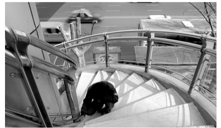
嵩山路人行过街天桥