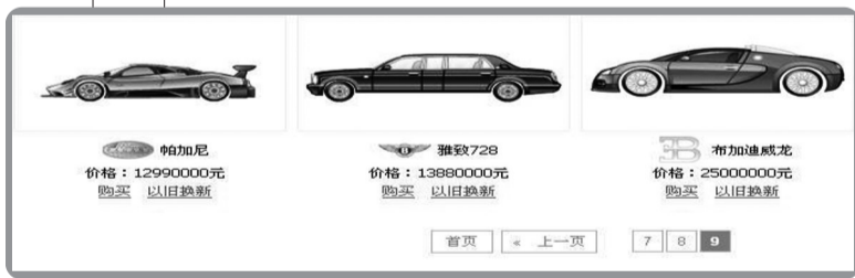
开心网的抢车位游戏

生活资讯 本栏目广告免费在《通通有》生活资讯、www.totoyou.net 同步发布 24小时广告热线 63399000 晚报大厦广告热线 67655128 投诉监督热线:63330302