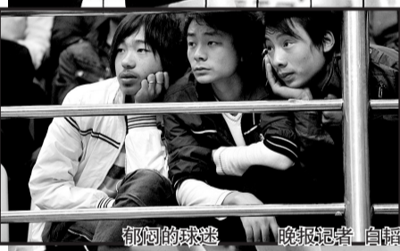
郁闷的球迷