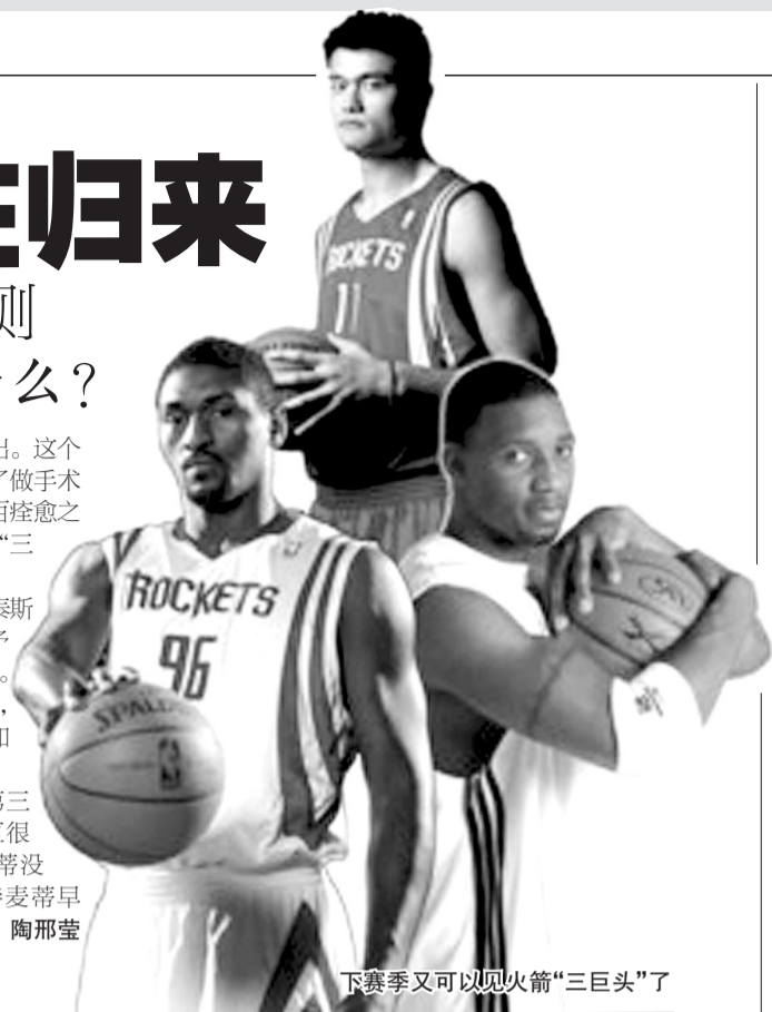
下赛季又可以见火箭“三巨头”了

事实上,在火箭稳居西部第三的日子里,更衣室里的氛围一直很和谐,阿泰不止一次表示:“麦蒂没有走,他只是去养伤了,我期待麦蒂早日健康归来。” 陶邢莹