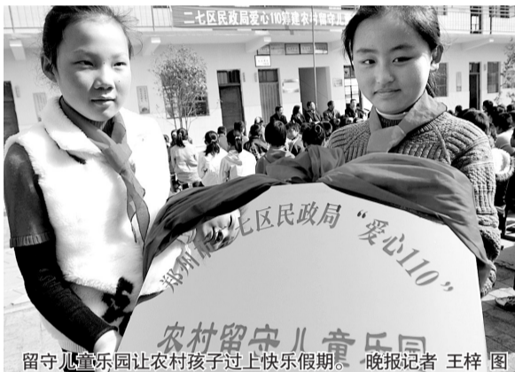
留守儿童乐园让农村孩子过上快乐假期。晚报记者 王梓 图