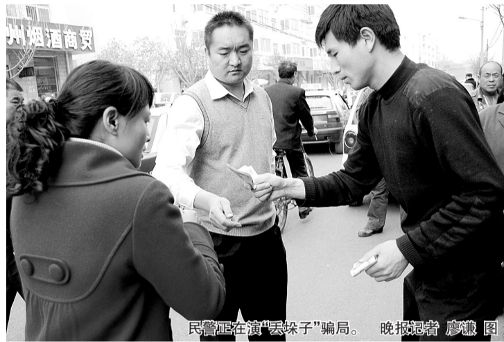
民警正在演“丢珠子”骗局。

昨日15时,在汝河路啟福花园社区门口,特巡警二大队民警和社区工作人员正在演示“丢珠子”骗局。当看到小品中的李女士因贪心想分骗子“捡”到的钱,财物反被骗子骗走时,一位大爷激动不已:“我一周前就是被人用这种丢包计骗走了900多元。”