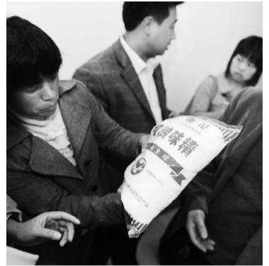
黑窝点包装好的“味精”