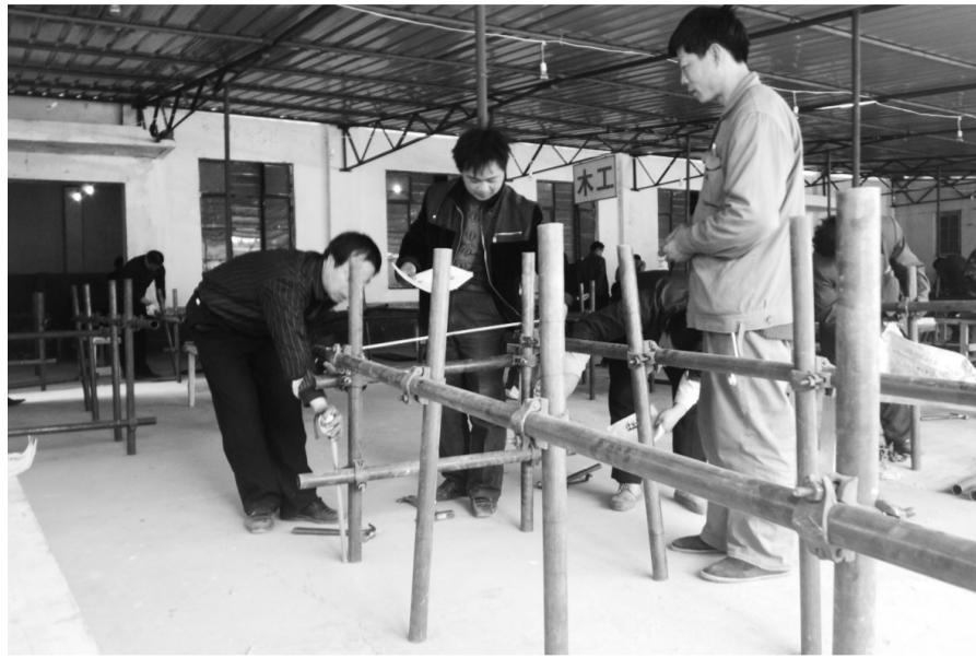
考生在建造钢筋支架。

考生:“在国外把活儿干坏,人就丢大了” “越着急就越做不好,手里总是出汗。”来自