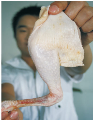
所以，许多监管部门常常会整车成吨的销毁农药残留严重超标的蔬菜水果。

现在许多蔬菜水果都喷洒农药用来抵抗病虫害，尤其是韭菜，种植户为了杀死根部的蛆虫，通常采取用农药水灌溉的方式进行保根，豆芽、辣椒、土豆、黄瓜、西红柿等大部分农作物都是用化肥和催长激素培育和嫁接出来的，早已没有了滋味。