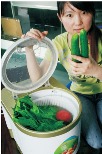
不到一毛钱，设计使用寿命长达50年。

海发消毒洗菜机在运转时可自动电击裂变成八级活性氧，杀菌效果威力无比，是目前国内通过国家专利产品的专利产品，只有青岛海发才具有此研发技术和生产能力。