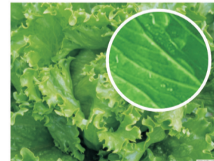
经过机洗后的蔬菜