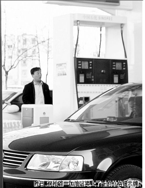
昨日如何拍摄——加油站换上了新的价格显示屏。

国家发改委24日宣布,鉴于近期国际市场原油价格持续上升,根据完善后的成品油价格形成机制,决定自3月25日零时起将汽、柴油价格每吨分别提高290元和180元。这是今年以来国家第二次调整成品油价,也是去年12月确定成品油税费改革以来第一次调高成品油价。昨日我省的汽柴油零售价格也随之上调,0号柴油最高每升涨了0.17元,93号汽油每升涨了0.25元。对此,有消费者提出疑问,为何我国油价对国际油价跟涨快跟跌慢?有关专家认为,这与我国按照新的成品油价格形成机制有关,而且今年将是油价调整最频繁的一年。