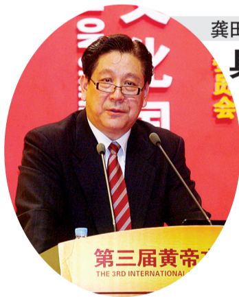
第三届黄帝文化国际论坛

夫推断，与天平行的画可能是古人给天看的，与天垂直的画是给人看的，因此具茨山岩画制作的内容是与天的对话。