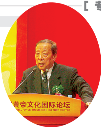
黄帝文化国际论坛

“能作为论坛嘉宾参加黄帝文化论坛，我感到十分荣幸。”作为一名著名的历史学家、古文字学家，李学勤对黄帝文化论坛十分推崇，他针对具茨山岩画发现的意义等大家关心的问题提出了自己的看法。