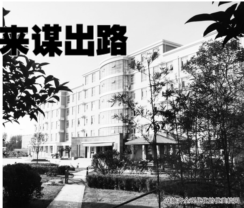
设施齐全现代化的优美校园

郑州商贸技师学院动漫培训品牌在培训理念上实行“实训与就业无缝对接”,从零开始,系统并全面教授动漫设计与制作技能,与日韩动漫企业和郑州、苏州、杭州、南京、无锡等国家动漫产业基地动漫企业开展校企合作和订单培训,培养的学生已成为市场上最紧缺、最受欢迎、工资待遇最高的专业人才。