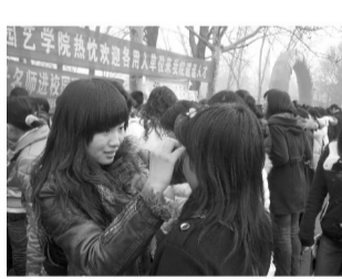
走进校园招聘会上免费为求职的毕业生进行化妆造型