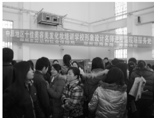
形象设计师进校园服务受欢迎

招生咨询电话:0371-63370996 63370997 63370998 63370999 校址:郑州市南阳路153号 详情请登陆:www.aohannet.com QQ咨询:805663700 545865879 876800201