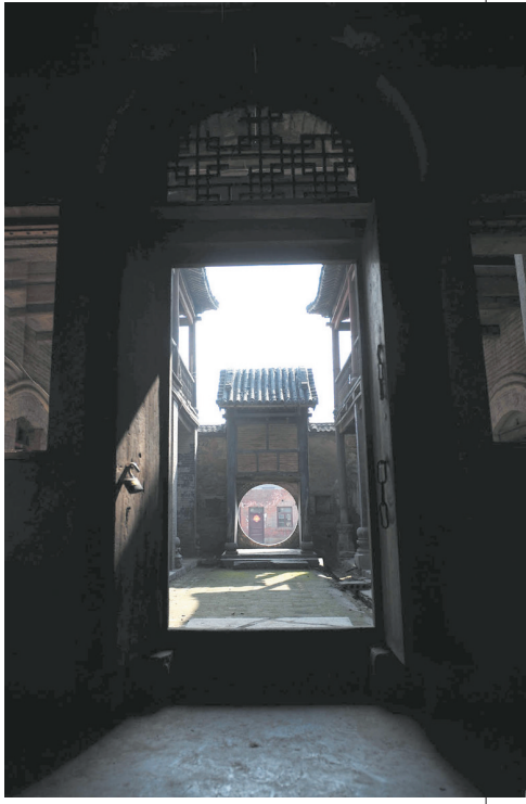
门洞的圆与深深庭院构筑的方搭配完美。