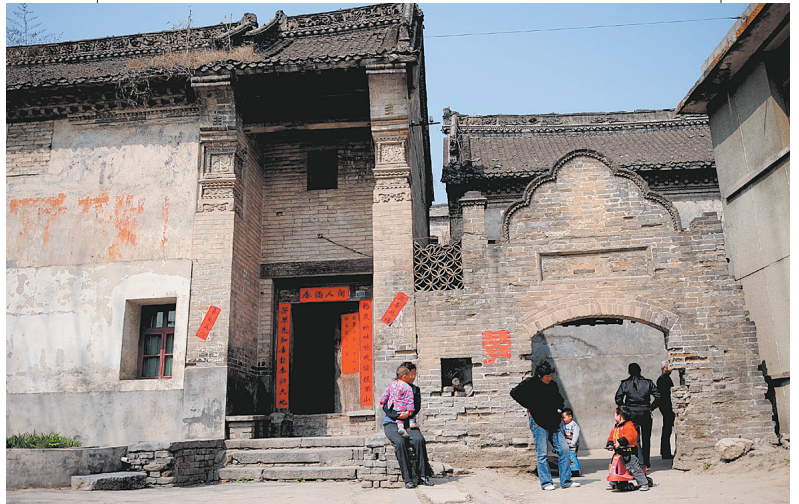
大宅门的人们悠然乐,至今有些宅院还住着几户不同姓氏村民。

为什么不是所有牛奶都叫特仑苏?迪拜的帆船酒店以其超豪华的标准而冠称七星酒店,特仑苏因其超极致的品质而荣膺“七星”牛奶;星级产地、星级奶牛、星级喂养、星级标准、星级工厂、星级工艺、星级营养七大星级指标,让特仑苏成为经典牛奶之典范。