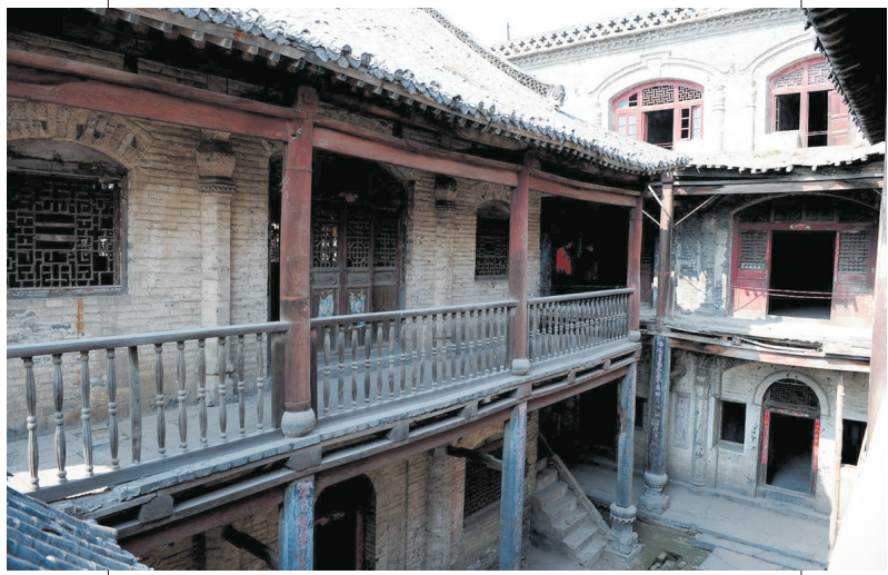
左右对称的院落,后面是依山而建的三层窑洞式楼房。