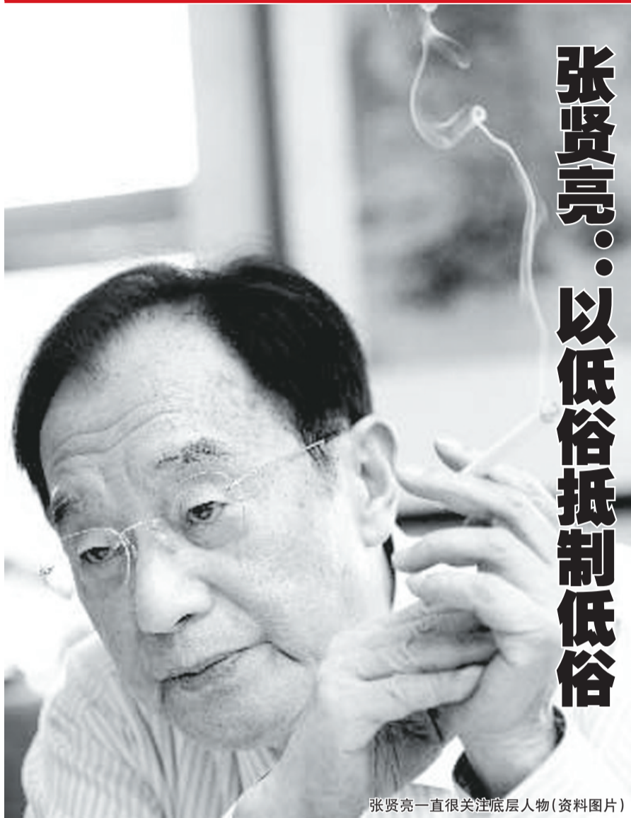
张贤亮一直很关注底层人物(资料图片)