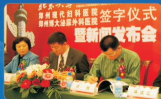
北京大学医学部与郑州博大泌尿外科医院正式签约