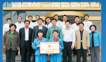
与会专家莅临郑州博大泌尿外科医院指导工作并合影留念