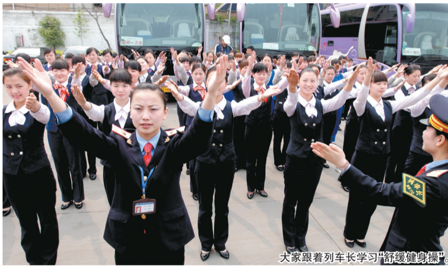
大家跟着列车长学习“舒缓健身操”。

本报讯 坐长途大巴时间久了, 难免会出现疲乏倦怠。从今日起, 郑州交运集团旗下的长途客车班线都将推出旅客舒缓健身操服务, 帮助旅客消除疲乏。