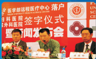
郑州博大泌尿外科医院何院长代表医院郑重承诺