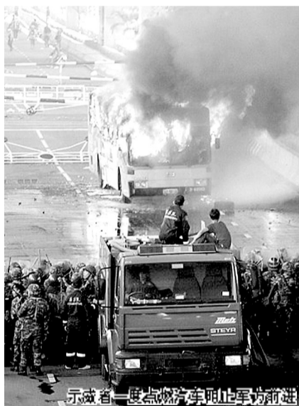
示威者一度点燃汽车阻止军车前进

泰国刑事法院当地时间14日下午对包括前总理他信在内的14名示威活动领导人发出逮捕令。已有4名示威领导人向警方自首。