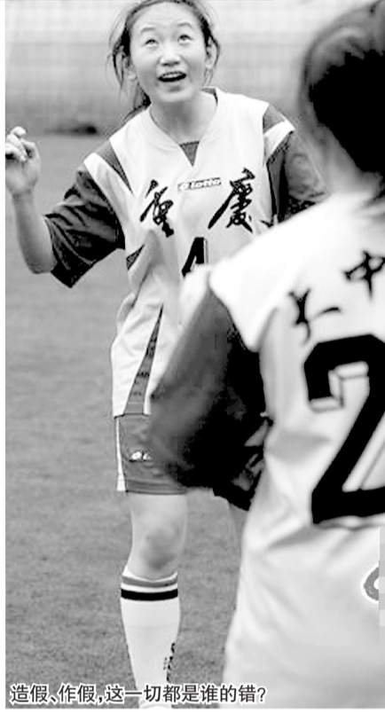
造假、作假,这一切都是谁的错?

造假、作假的事情在中国足坛并不稀奇,近日出现重庆大坪中学队在世界中学生女足锦标赛中所向披靡,六战全胜勇夺世界冠军后,被人翻出参赛队员非该校学生的丑闻也就不足为奇了。翻看2008年全国女足中学生比赛成绩表,重庆大坪中学队仅获得第6名。一支全国第6名的球队就能夺取世界冠军?显然,这不可能。随着相关调查的深入,真相也一点点浮出了水面。