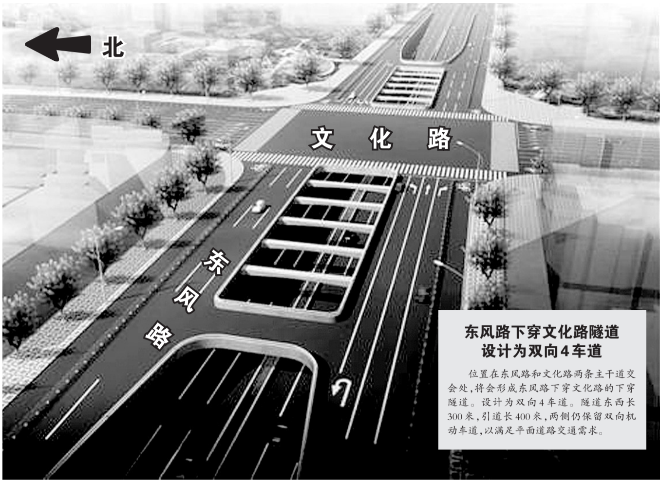
东风路下穿文化路隧道设计为双向4车道

昨日,郑州规划网上公示了嵩山下穿陇海铁路立交拓宽方案,金水路下穿京广、陇海铁路立交拓宽方案和航海路下穿京广铁路立交拓宽方案。记者随后向郑州市规划局了解详细信息时,意外得知东风路下穿文化路隧道(双向4车道)规划已经获批,并有望于近期开工。建成后文化路东风路口可以一扫“郑州最堵路口”的恶名了。 晚报记者 李萌