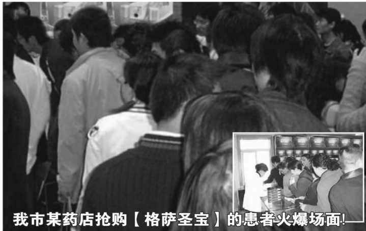
我市某药店抢购【格萨圣宝】的患者火爆场面！

患者心里都有笔账：除了【格萨圣宝】立竿见影的疗效之外，原价29元/盒，现在6.6元/盒，买3疗程还能赠15盒，这是史无前例的超大优惠，机会千载难逢，难怪会引起抢购狂潮。